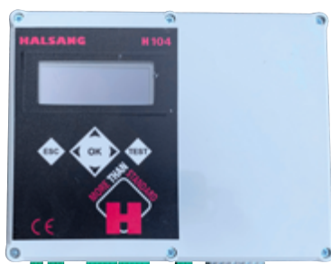
Styrskåp utrustat med Halsang H104-styrenhet.