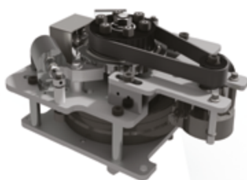
Vändkorsmekanism – kvalitetsbroms med kort svarstid.